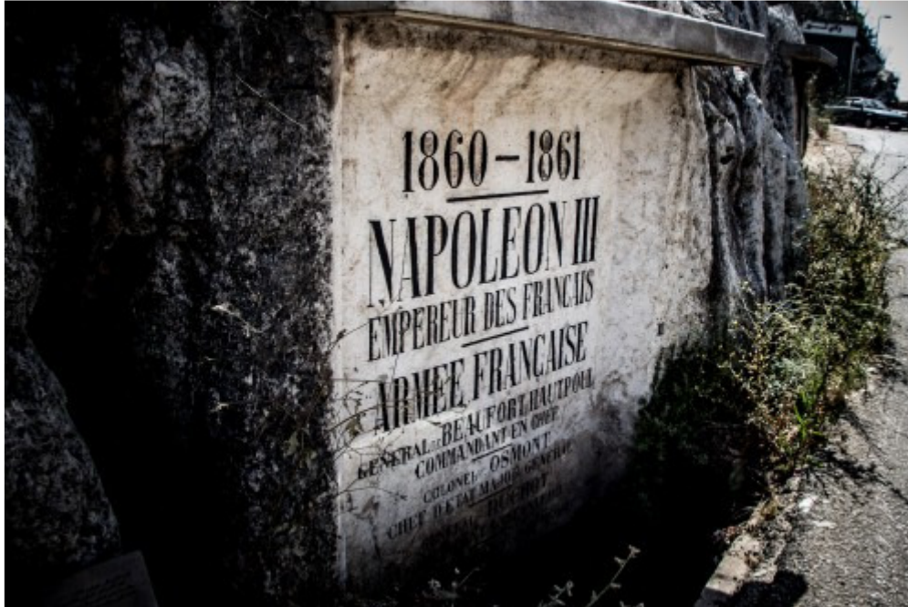
Stèle de l'Empereur Napoléon III (1860 – 1861)

L'inscription fut gravée pour l'Empereur Napoléon III au terme d'une expédition entreprise pour mettre fin au conflit qui opposait druzes et maronites en 1860. Les noms des différents bataillons qui participèrent à cette mission y sont mentionnés.